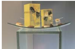
Peana con SGG BALDOSA GRABADA Salone del Mobile, Milán.

Como todo diseño de la gama de vidrio impreso SGG DECORGLASS, SGG BALDOSA GRABADA se fabrica conforme a la norma UNE EN 572 Vidrio para la edificación, productos básicos de vidrio, vidrio de silicato sodocálcico, parte 5: vidrio impreso.