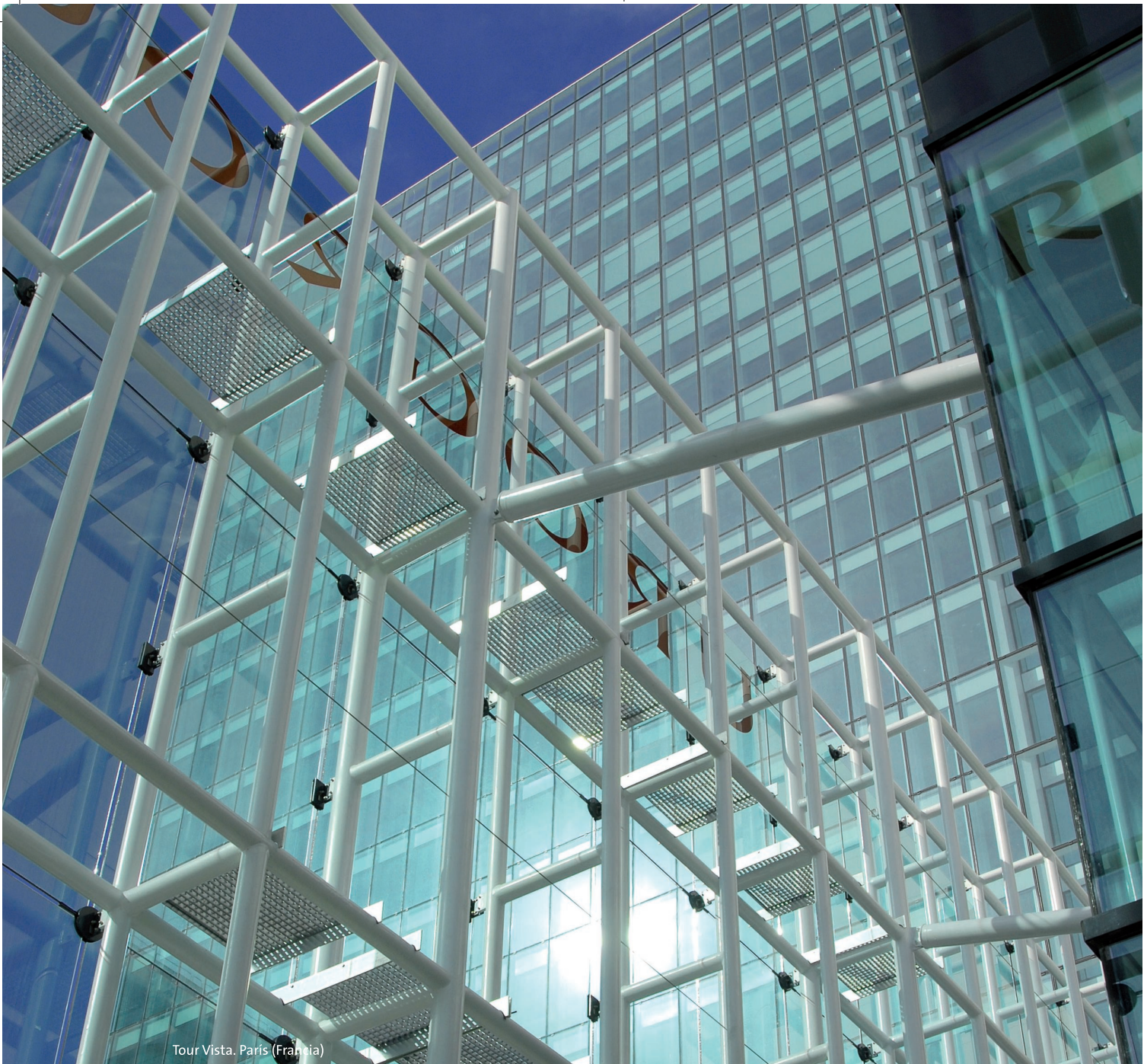
Tour Vista. París (Francia)