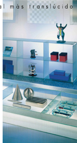
Diseño sgg ESTRIADO

Los nuevos diseños SGG THELA, SGG MARIS y SGG NEMO renuevan la amplia gama de vidrios impresos. Inspirados en un material natural, el lino, ofrecen interesantes posibilidades en materia de texturas y luminosidad en los espacios en los que se integran.