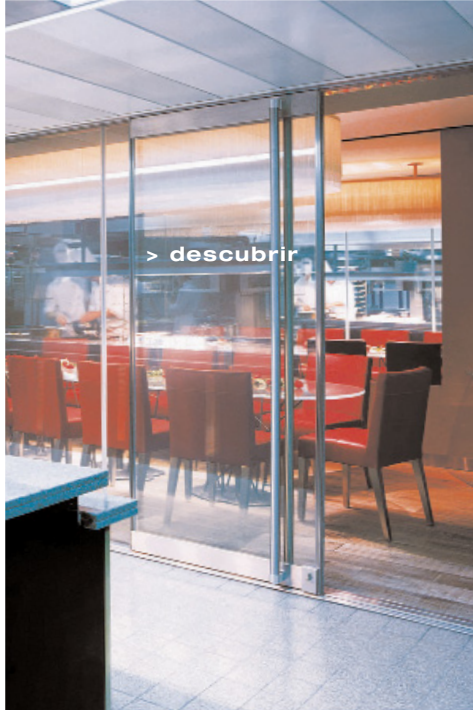
Dorchester Hotel, Bruselas - Instalación - Optima Architectural Glass