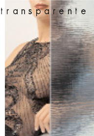
Diseño sgg THELA