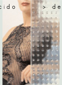
Diseño sgg MASTER-CARRÉ

> del más transparente al más translúcido