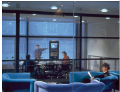
Villa Bakke - Arquitecto - MMW Oslo

La magia de un vidrio que cambia su apariencia de transparente a translúcido a voluntad del usuario, accionando un simple interruptor eléctrico. Gracias a la tecnología innovadora de los cristales líquidos, es posible modificar la transparencia del vidrio, de manera instantánea , según las necesidades de intimidad requeridas. SGG PRIVA-LITE puede utilizarse también como pantalla de retro-proyección para proyectar imágenes.